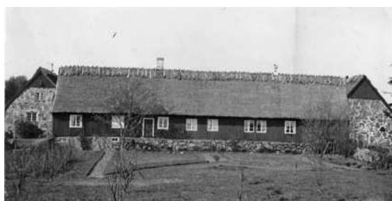
Grönhult, Stenestad på 1920-talet